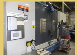
VTC 200 C