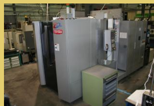
FH 550 SX